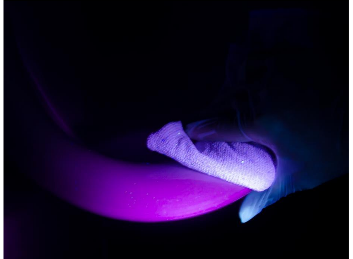
Istuinrenkas puhdistuksen jälkeen