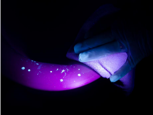
Istuinrenkas ennen puhdistusta